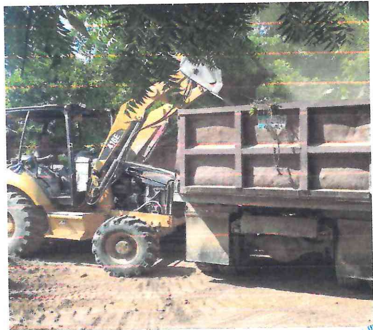
TERRACERIAS: Carga por medios mecanicos y acarreo en camion volteo de materiales sobrante de excavaciones a primer kilometro y tres kilometros subsiguientes en zona sub-urbana y carretera, incluye: la mano de obra, herramienta, maquinaria y el equipo necesario.