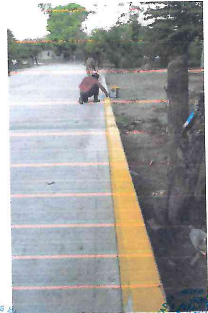
PINTURA EN GUARNICIONES. Pintura en guarnición por medios manuales con pintura a base de resinas alquídicas color amarillo, incluye: materiales, mano de obra, limpieza y herramientas.