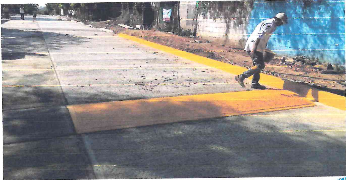
PINTURA EN GUARNICIONES. Pintura en guarnicion por medios manuales con pintura a base de resinas alquidolicas color amarillo, incluye: materiales, mano de obra, limpieza y herramientas.

No. OF. DE AUTORIZACIÓN: OF/FAISMUN/0005/0014/2023 DE FECHA 25 DE OCTUBRE DE 2023.